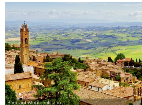
Blick auf Montepulciano