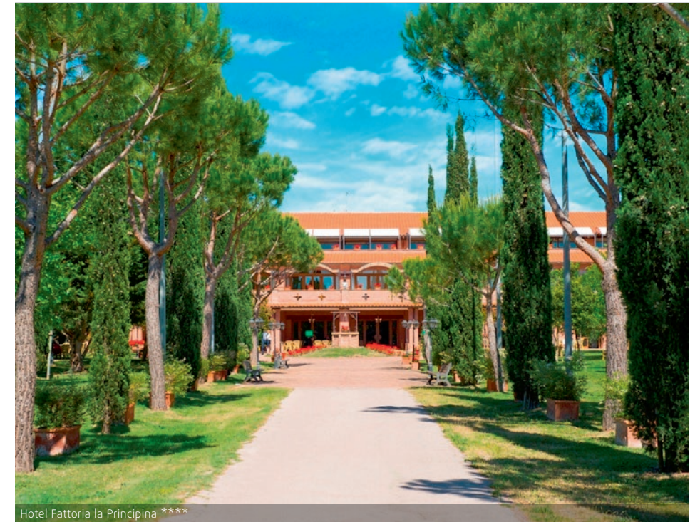
Hotel Fattoria la Principina ****

Ihr 4-Sterne-Urlaubsdomizil Hotel Fattoria la Principina (Landeskategorie) befindet sich im Herzen der Maremma inmitten eines einhundert Hektar großen weitläufigen Gehöftes. Alle Zimmer sind im toskanischen Stil eingerichtet und verfügen über ein Bad mit Dusche oder Badewanne, WC und Föhn. Zu den weiteren Annehmlichkeiten zählen Klimaanlage, SAT-TV, WLAN, Telefon, Mietsafe, Minibar sowie Balkon oder Terrasse. Das Hotel hat mehrere Restaurants und eine Bar mit Terrasse. Ein Außenpool mit Liegen befindet sich mitten im Grünen. Der